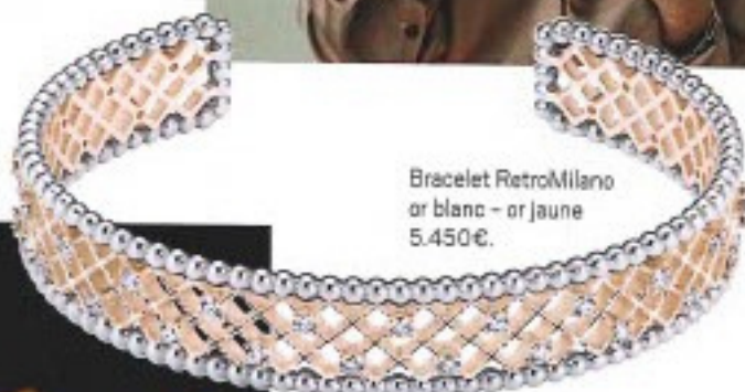
Bracelet RetroMilano or blanc - or jaune 5.450€.

Ti Sento , la marque milanaise de bijoux couvre la femme de différentes collections créant un style accessible, personnalisé et tendance. Combinez colliers et pendentifs, charms et boucles d'oreilles, bagues et bracelets pour 'Your personal touch' ! Spécificité de la marque : l'argent fin '925'. Bracelets : 65 €, 279€, 229 € Colliers : 249 €, 1.499 €, Boucles d'oreilles : 149 €, Bagues : 49 €, 109 €, 179 € www.tisento-milano.fr