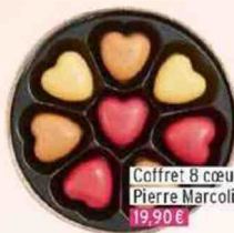
Coffret 8 cœurs, 56 g, Pierre Marcolini 19,90 €