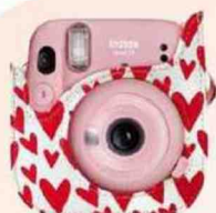
Appareil photo Instax 40. Fujifilm 99,99 €