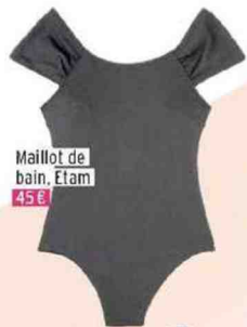
Maillot de bain, Etam 45 €