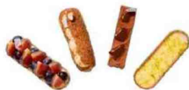
Coffret 4 pâtisseries, Oh Oui! 24 €