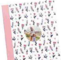
Album photo, de 26 à 96 p., Cheerz A partir de 24,90 €