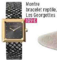
Montre bracelet reptile, Les Georgettes 109 €