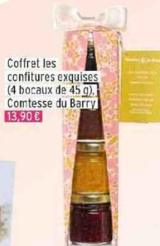
Coffret les confitures exquises (4 bocaux de 45 g), Comtesse du Barry 13,90 €