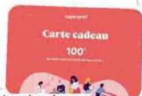
Carte-cadeau de cours avec le prof de mon choix, Superprof 100 €