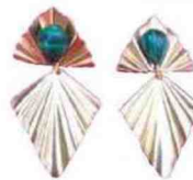
Boucles d'oreilles, Noir Madeleine 19 €