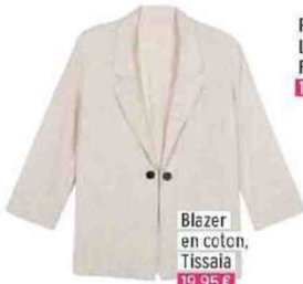
Blazer en coton, Tissaia 19,95 €