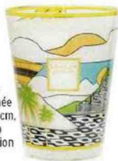
Bougie parfumée Rio, 24 cm, Baobab Collection 275 €