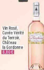
Vin Rosé, Cuvée Vérité du Terroir, Château la Gordanne 8,80 €