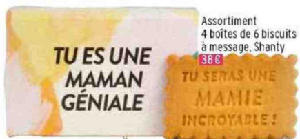
Assortiment 4 boîtes de 6 biscuits à message, Shanty 38 €