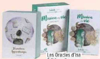
Les Oracles d'Isa Éditions Exergue 24,90 € (L'UN)