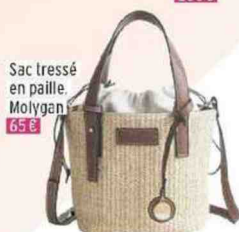
Sac tressé en paille, Molygan 65 €