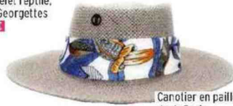
Canotier en paille, Joe's Paris 49,90 €