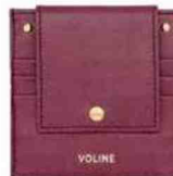
Porte-monnaie en cuir de vachette, Voline 129 €