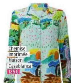
Chemise imprimée, Maison Casablanca 125 €