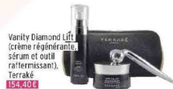
Vanity Diamond Lift (crème régénérante, sérum et outil raffermissant), Terraké 154,40 €