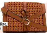
Sac à bandoulière, Lollipop 69 €