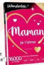
Coffret "Maman je t'aime", 16 000 activités, Wonderbox 99,90 €