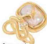
Bague quartz et diamant, Ole Lynggaard 5360 €