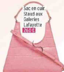
Sac en cuir, Staud aux Galeries Lafayette 260 €