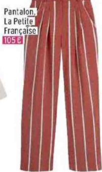
Pantalon, La Petite Française 105 €