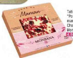
Tablette "Pour ma maman", Chocolaterie Monbana 4,80 €