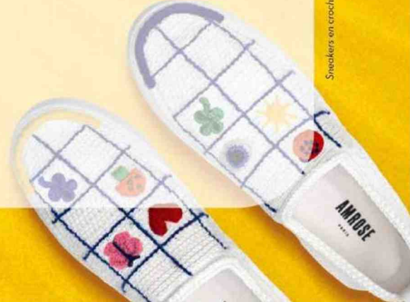
Sneakers en crochet, Amrose