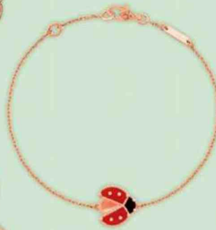
Van Cleef & Arpels