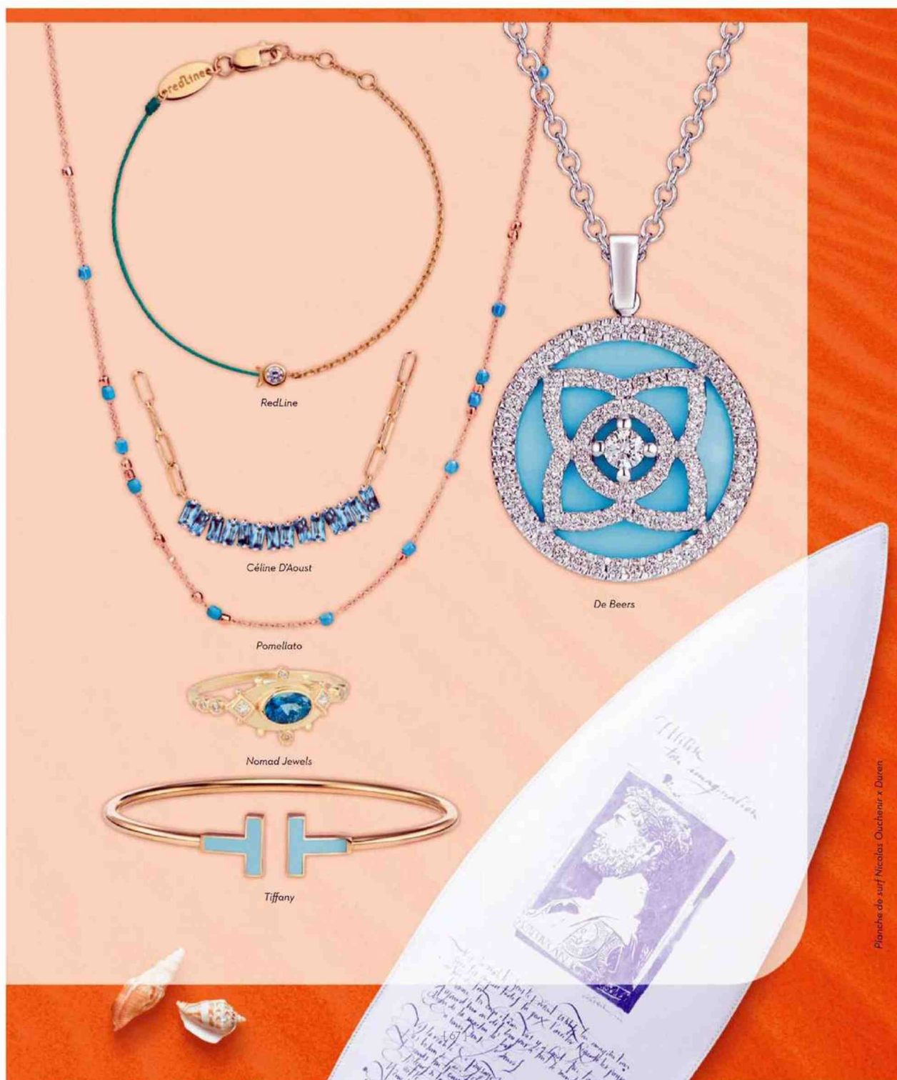
Planche de sur | Nicolas Ouchemir x Duren